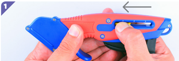
Placez la molette en Position 1