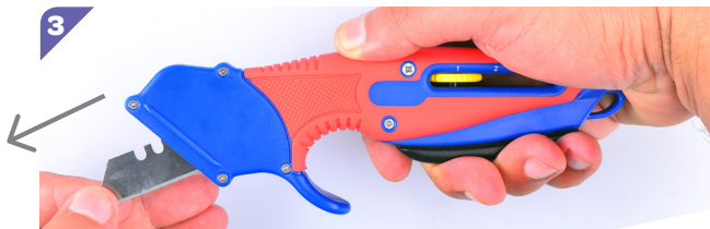
Extraire la lame usagée en tirant dessus