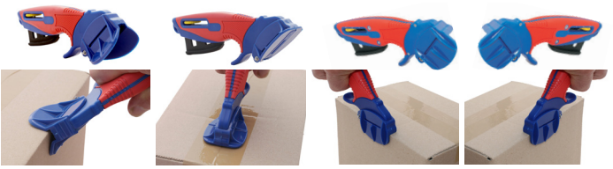
CS 072 monté avec une tête en V

Position 3 : Molette en position arrière permet d'actionner la gâchette et de régler la longueur de sortie de lame.