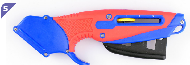
Une fois que la lame bute sur le fond du bec, elle est en place et vous pouvez relâcher la gâchette