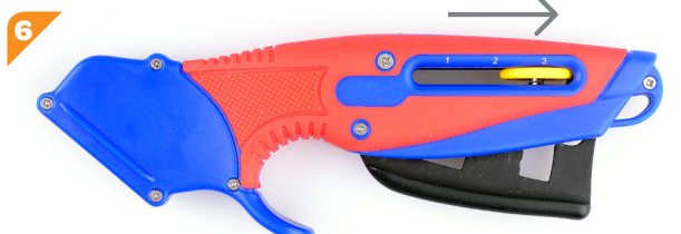
Il faut repositionner la molette en position 3 de travail et le couteau est prêt à l'emploi !