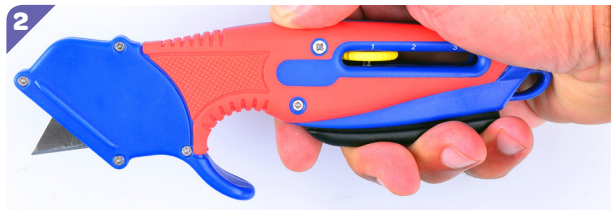
Appuyez sur la gâchette avec une main et sortez la lame usagée avec l'autre main.